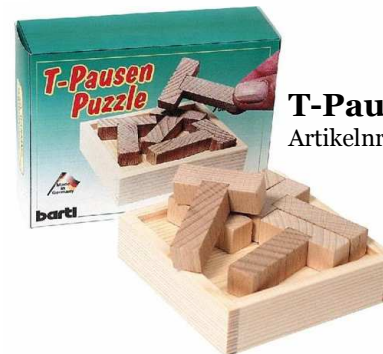
T-Pausen Puzzle Artikelnr.: b2807