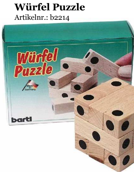
Würfel Puzzle Artikelnr.: b2214