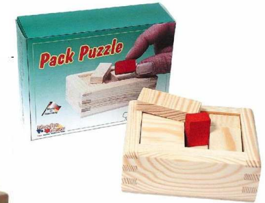
Pack Puzzle Artikelnr.: b2218