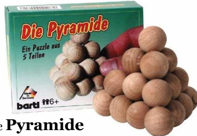
Die Pyramide Artikelnr.: b4560