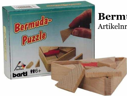
Bermuda Puzzle Artikelnr.: b6541