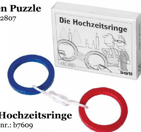
Die Hochzeitsringe Artikelnr.: b7609