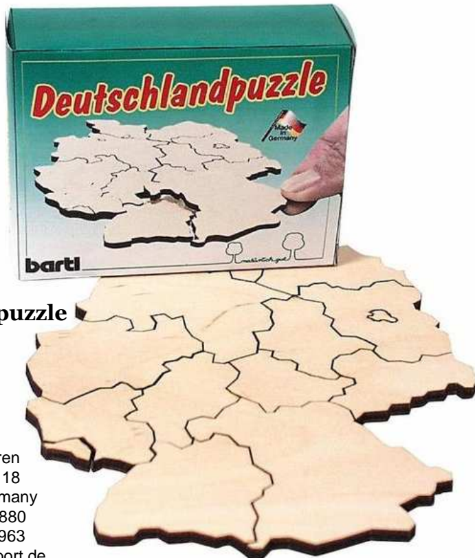
Deutschlandpuzzle Artikelnr.: 2359

Herausgeber: Inka Dreisbach Spielwaren Theodor Heuss Strasse 18 57271 Hilchenbach Germany Telefon: +49 02733 128880 Telefax: +49 02733 813963 E-Mail: huhu@puzzle-sport.de Internet: www.puzzle-sport.de Umsatzsteuer-Identifikationsnummer: DE 235024035