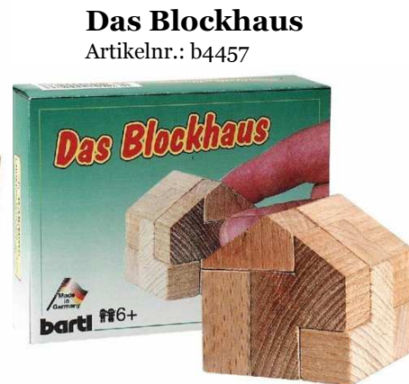
Das Blockhaus Artikelnr.: b4457