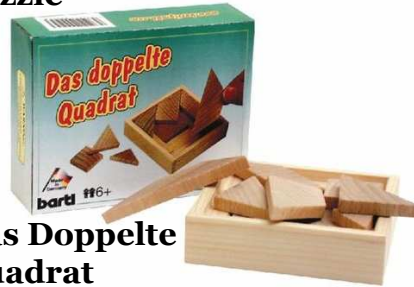
Das Doppelte Quadrat Artikelnr.: b6542