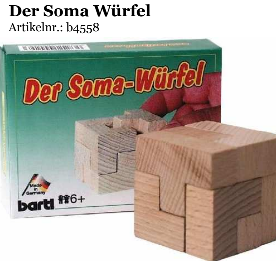
Der Soma Würfel Artikelnr.: b4558