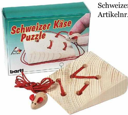
Schweizer Käse Puzzle Artikelnr.: b3785