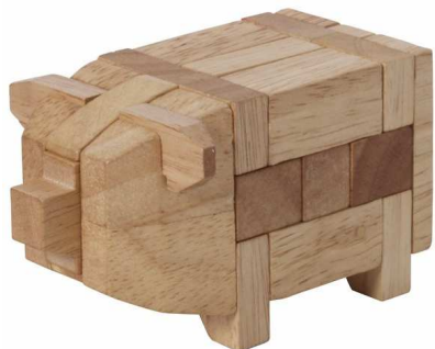
Mi Tierpuzzle Schwein Artikelnr.: b9421