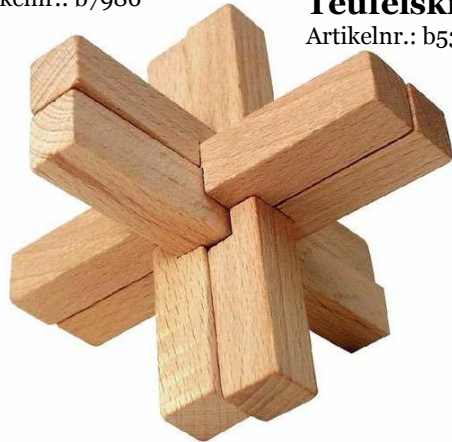
Teufelsknoten Artikelnr.: b5382