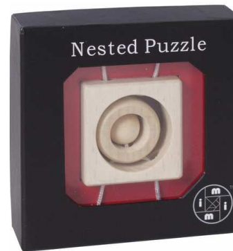
Mi Puzzle Nested Quadrat Artikelnr.: b9430