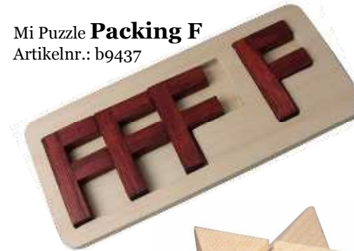
Mi Puzzle Packing F Artikelnr.: b9437