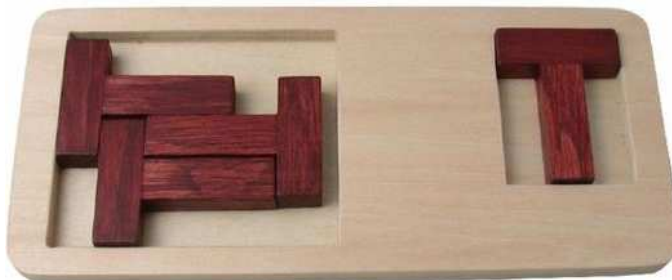
Mi Packing T Puzzle Artikelnr.: b9439