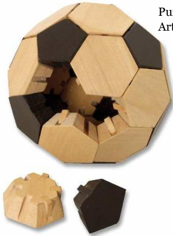
Puzzle Fußball Artikelnr.: b7986