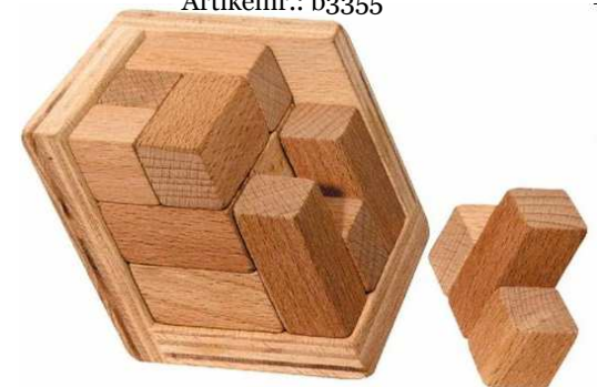
Schräglicher Würfel Artikelnr.: b3355