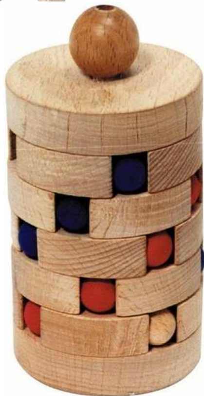
Kugelturm Artikelnr.: b1545

Herausgeber: Inka Dreisbach Spielwaren Theodor Heuss Strasse 18 57271 Hilchenbach Germany Telefon: +49 02733 128880 Telefax: +49 02733 813963 E-Mail: huhu@puzzle-sport.de Internet: www.puzzle-sport.de Umsatzsteuer-Identifikationsnummer: DE 235024035